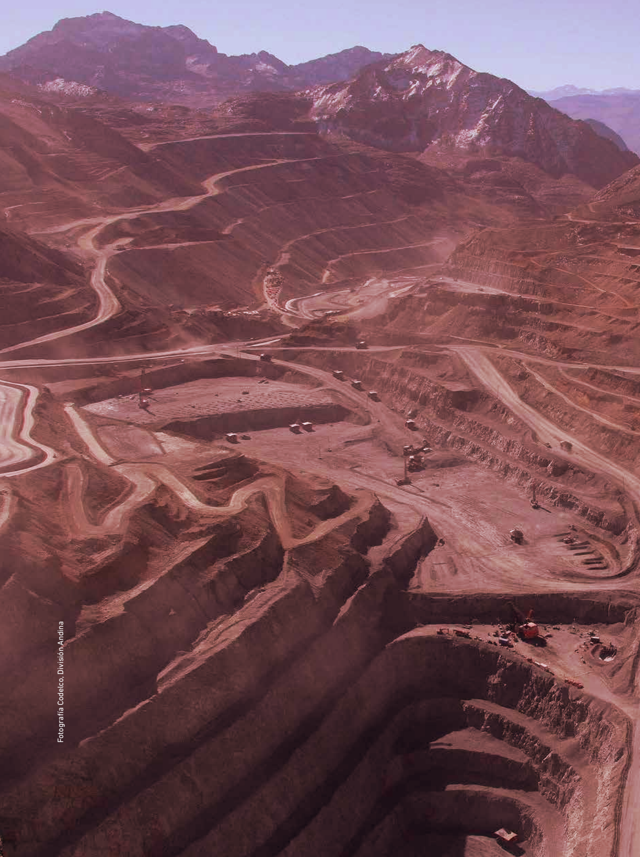
Fotografía Codeico, División Andina