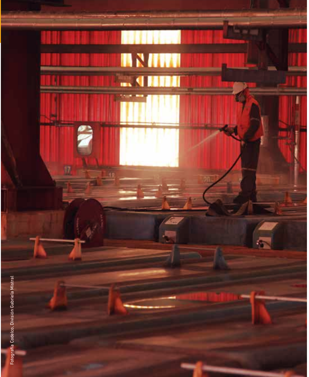
Fotografía Codeco, División Gabriela Mistral